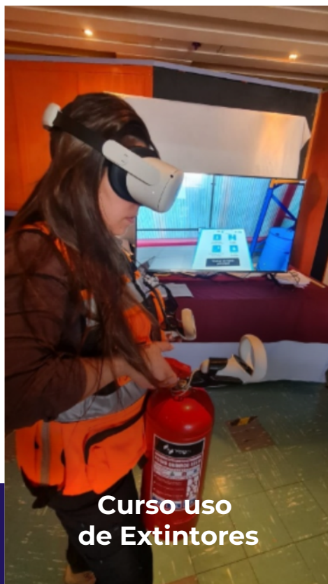
Curso uso de Extintores