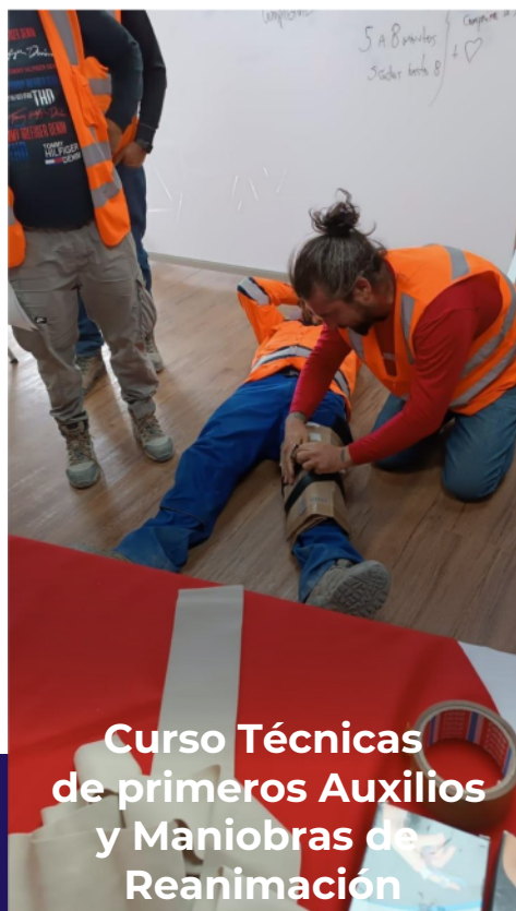
Curso Técnicas de primeros Auxilios y Maniobras de Reanimación

Contamos con facilitadores permanentes en terreno.